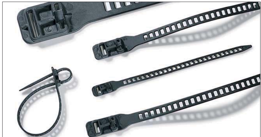
Elastisiteten i SOFTFIX-båndene gjør dem velegnet til en rekke formål.

Det myke fleksible materialet gjør disse båndene spesielt velegnet for bruk på fiber-optiske kabler. Andre bruksområder er for eksempel applikasjoner innen hagebruk og landskapsindustri som f.eks. å binde opp trær og andre vekster.