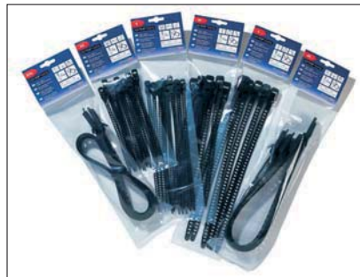
SOFTFIX buntebånd er tilgjengelig i små forpakninger.